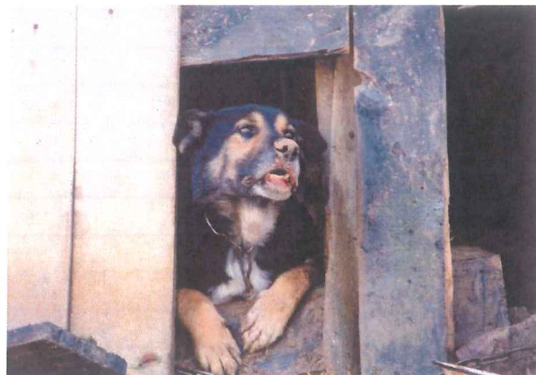
Zdiagnozowany w 2012 r. w pow. rzeszowskim przypadek wścieklizny u psa (postać szalowa)

Wyróżnia się 2 postaci choroby: agresywną (szałową) i cichą (porażenną).