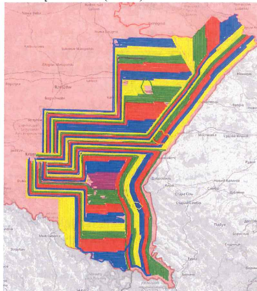
Zasięg dodatkowej akcji doustnych szczepień lisów wolno żyjących w woj. podkarpackim w 2024 r.

Dodatkowo wyłożono ręcznie 14 000 dawek w części powiatów województwa: 7 000 dawek w powiatach: brzozowskim, jarosławskim, leskim, lubaczowskim, przemyskim, sanockim i bieszczadzkim oraz 7 000 dawek w strefie przygranicznej ADIZ, gdzie nie mogą operować samoloty, w powiatach przygranicznych, tj. lubaczowskim, jarosławskim, przemyskim i bieszczadzkim, we współpracy z Bieszczadzkim Oddziałem Straży Granicznej w terenie przygranicznym.